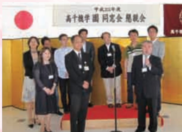
ホームカミングデーの出席者