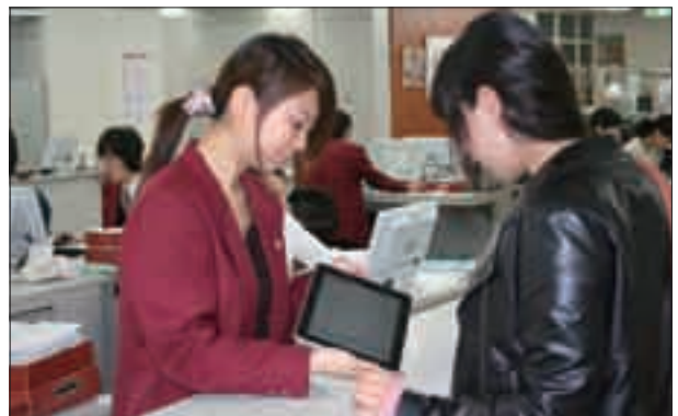
iPad を利用した履修相談