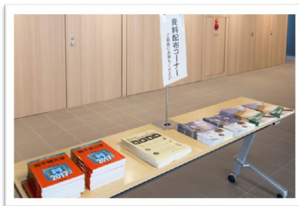
OCでは赤本も無料配布してます！