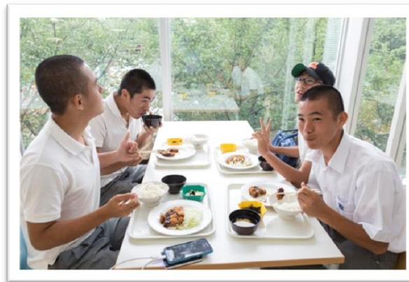
仲よし4人組、学食いかがでしたか