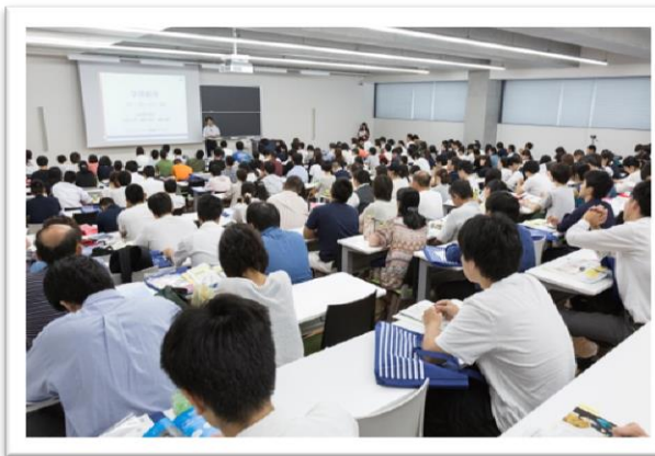
たくさんの方々にご参加いただきました