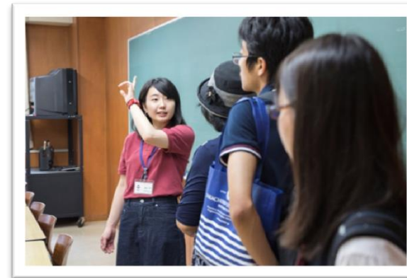
キャンパスツアーは今日も大人気