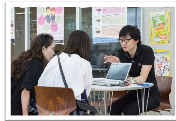
PCを使って詳しく相談に乗ってます