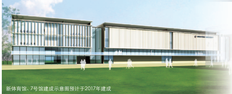
新体育馆、7号馆建成示意图预计于2017年建成