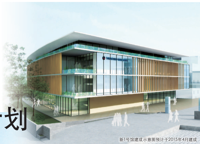
新1号馆建成示意图预计于2015年4月建成