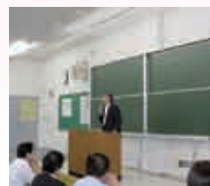
学長による大学の近況報告