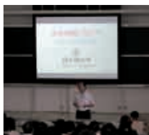
就職指導について