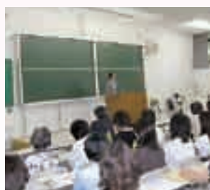
理事長による近況報告