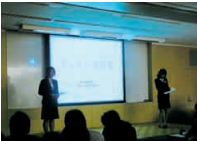
第1回 プレゼンテーション講習会

今後も私たちはゼミ生のニーズに応えられるような企画をしていきたいと思うと同時に、ゼミ発表会の成功を目指して日々努力をしていきますので、皆様の暖かいご声援のほどよろしくお願ひします。