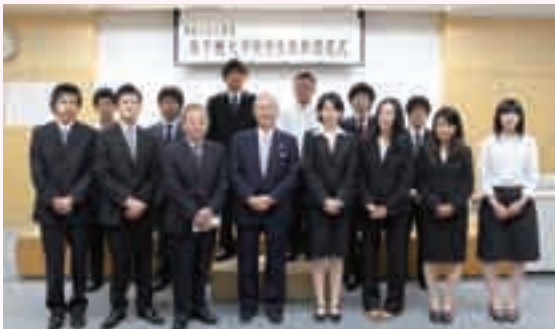
高千穂学園同窓会奨学金認定者

同窓会の主な事業は、①同窓会主催の総会・忘年懇親会の開催 ②同窓会会報誌「TAKACHIHO」の発行 ③地区高千穂会への支援 ④大学支援として同窓会奨学金の授与、運動部やゼミ連への奨励金の贈呈、高千穂祭への協力などです。