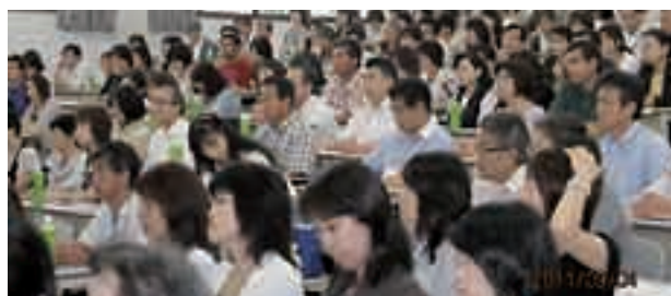
父母懇談会参加者