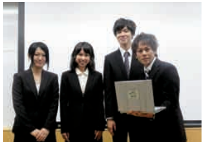
プレゼンテーション講習会を終えて