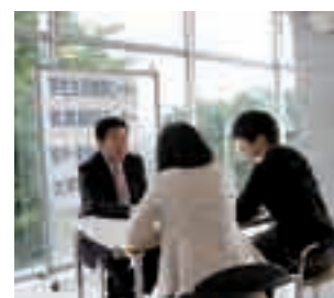
先生との個別面談