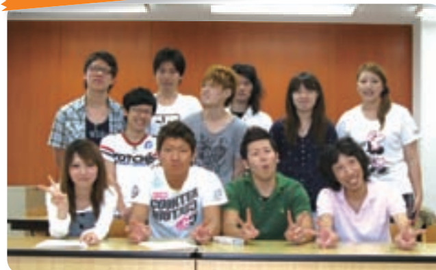
○ゼミ員数：12名（男：9名・女：3名）