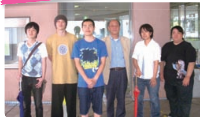
○ゼミ員数：14名（男：10名・女：4名）