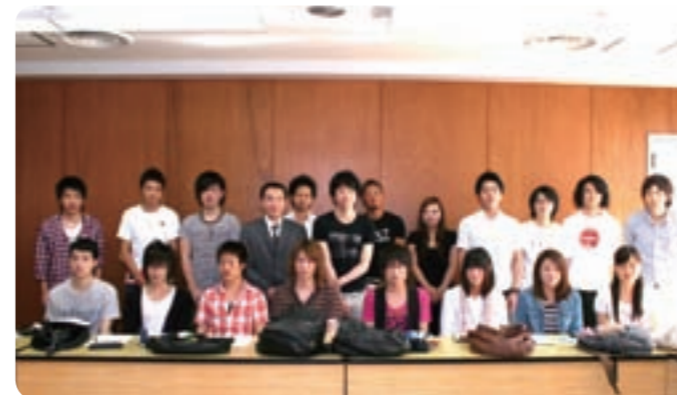
○ゼミ員数：21名（男：15名・女：6名）