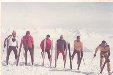
昭和50年3月 アラスカ(ヘリスキー)

てくれた。その成果が実り関東大学秋季リーグ戦で4部優勝を果たした。部創設5年目の快挙で喜びもひとしおであった。 専門科目として体育理論と実技を担当してきたが、当時は種目も限られバレーボールとバスケットボールが中心の授業であった。私は専門が器械体操で陸上や球技は苦手であった。授業にマット運動を導入したこともあったが、学生達には残念ながら喜んでもらえなかった。その後、昭和47年に体育館が新設され徐々に実技種目も増えていった。テニス、バドミントンなども経験が少なかったので放