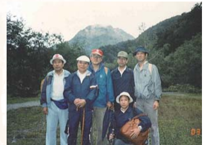
平成3年9月 恩師と共に(上高地)

勿論であったが、大学間の情報交換を得る場として有益であった。これを機にスキー仲間が増え、アラスカやカナダにも足を運んだ。